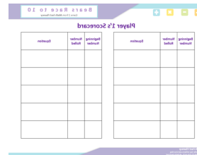
Tarjeta de Puntuación