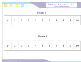
Tablero de Juego

Materiales: Para cada par de jugadores se necesitan: dos líneas numéricas del 0 al 10 (o un tablero de juego con cuadrados etiquetados 0-10) para hacer una "pista de carreras" (uno para cada estudiante), dos osos de plástico o fichas (uno para cada estudiante), un dado etiquetado +0, +0, +1, +1, +2, +2. Ver las variaciones de Carreras de Osos en la página 25. Se incluye una tarjeta de puntuación como opción para aquellos alumnos que están listos para escribir ecuaciones.